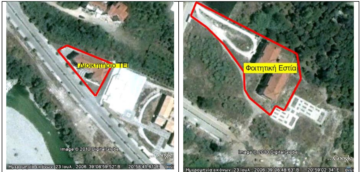
Διοικητήριο ΤΕΙ (αριστερά) και Φοιτητική Εστία (δεξιά)