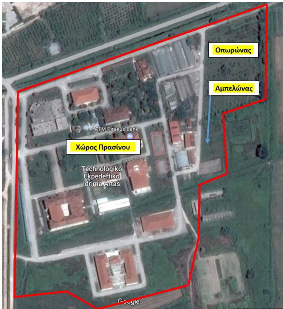
Τεχνόπολη (Campus) Κωστακίων ΤΕΙ Ηπείρου