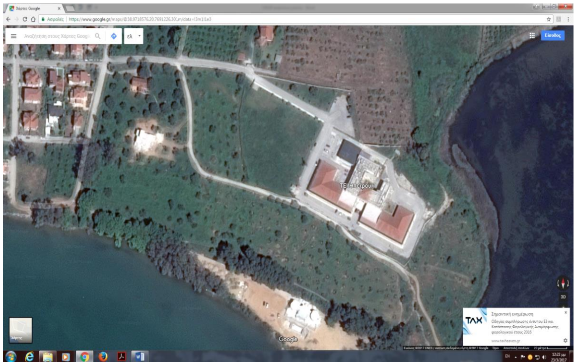
Τμήμα ΛΟ.ΧΡΗ Πρέβεζα