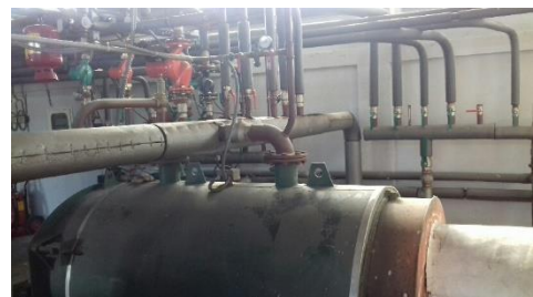
Φωτογραφίες υπάρχουσας κατάστασης (τυπικής) σύνδεσης λέβητα (1 ου από αριστερά) με συλλέκτες εισαγωγής – επιστροφής