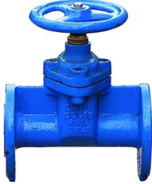
Ενδεικτική μορφή βάνας σύρτου ελαστικής έμφραξης

Οι λέβητες πρέπει να διαθέτουν εξοπλισμό ασφαλείας κατά DIN 4751-2 για εγκαταστάσεις με θερμοκρασία προσαγωγής έως 100°C. Ο θερμοστάτης ασφαλείας θα διακόπτει την λειτουργία του καυστήρα μόλις το νερό φτάσει σε θερμοκρασία 95°C.