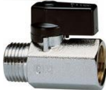
ενδεικτικές μορφές μανομέτρου mini διακόπτη

Θα γίνει τοποθέτηση μανομέτρων γλυκερίνης στους δύο συλλέκτες (προσαγωγής και επιστροφής) της εγκατάστασης θέρμανσης του κτιρίου του ΤΕΙ Ηπείρου στα Ιωάννινα, με ταυτόχρονη τοποθέτηση mini διακόπτη ανάμεσα σε σωλήνα και μανόμετρο (στην τιμή περιλαμβάνεται και η τοποθέτηση του mini διακόπτη). Για την τοποθέτηση του μανομέτρου θα δημιουργηθεί οπή στο συλλέκτη και θα κολληθεί μούφα.