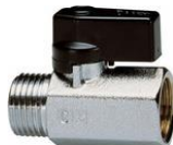
Ενδεικτικές εικόνες απαερωτή mini διακόπτη

Θα γίνει νέα τοποθέτηση απαερωτών της εγκατάστασης μέσα στο χώρο του Λεβητοστασίου, με ταυτόχρονη τοποθέτηση mini (ή σφαιρικού) διακόπτη ανάμεσα σε σωλήνα και απαερωτή, για την εύκολη μελλοντικά αντικατάστασή του. Οι απαερωτές θα συνδεθούν από ένας σε κάθε συλλέκτη και μέσω σωλήνα σε κάθε περίπτωση θα καταλήγουν ψηλότερα από το ψηλότερο σημείο των σωλήνων μέσα στο χώρο του λεβητοστασίου.