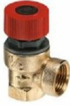
Ενδεικτική μορφή Βαλβίδα ασφαλείας

Θα γίνει αντικατάσταση με νέες των βαλβίδων ασφαλείας στους δύο παλιούς λέβητες που θα παραμείνουν στην εγκατάσταση θέρμανσης του κτιρίου του ΤΕΙ Ηπείρου στα Ιωάννινα και τοποθέτηση νέων βαλβίδων ασφαλείας στους δύο νέους που θα τοποθετηθούν.