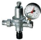
Ενδεικτική μορφή αυτόμ. πλήρωσης