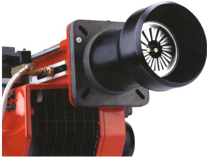
Ενδεικτική μορφή καυστήρα

Ο νέος καυστήρας θα είναι διβάθμιος (2 μπεκ). Ο έλεγχος του αέρα καύσεως θα γίνεται διαμέσου ενός υδραυλικού εμβόλου, στο σταμάτημα δε του καυστήρα θα έχουμε ολικό φράγμα του ντάμπερ του αέρος ώστε να επιτυγχάνεται πρόσθετη εξοικονόμηση ενέργειας.