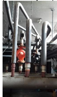
Συλλέκτες εισαγωγής – επιστροφής, όπως φαίνονται από την πίσω πλευρά του λέβητα Νο 1 από αριστερά που θα αντικατασταθεί.

Σκαρίφημα σύνδεσης νέων βανών και νέων λεβήτων – καυστήρων στους συλλέκτες προσαγωγής – επιστροφής.