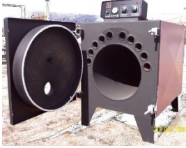
Ενδεικτική μορφή λέβητα

Στην αρχή θα γίνει υδραυλική αποξήλωση και απομάκρυνση του παλαιού λέβητα.