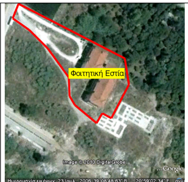
Διοικητήριο ΤΕΙ (αριστερά) και Φοιτητική Εστία (δεξιά)